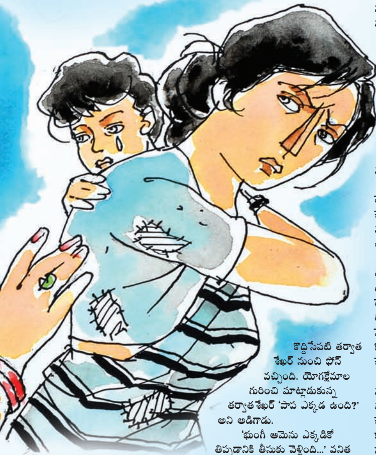
కొద్దిసేపటి తర్వాత శేఖర్ నుంచి ఫోన్ వచ్చింది. యోగక్షేమాల గురించి మాట్లాడుకున్న తర్వాత శేఖర్ 'పాపం ఎక్కడ ఉంది?' అని అడిగాడు.

మామూలుగా అయితే ఆమె ఇంటికి రాగానే పాపం ఎగిరి గంతులేసుకుంటూ తన ముందుకు వస్తుంది. కానీ ఈ రోజు పాపగానీ, భుంగీ కానీ ఎవరూ కనిపించలేదు. వనిత మామగారి గదిలోకి వెళ్లి తొంగి చూసింది. అక్కడ అత్తగారు కూర్చోని ఉంది. ఆమె మామయ్య అరికాళ్ళకు నూనె రాస్తోంది. 'మీరు పాపను చూసారా?' వనిత అడిగింది. 'భుంగీ కూడా కనిపించడం లేదు' అని అంది. 'ఆమె తరచుగా పాపను తీసుకుని పార్క్లో తిరగడానికి తీసుకువెళుతుంది' అత్త చెప్పింది. 'వస్తుండొచ్చు' అని అంది. వనిత చేతులు, ముఖం కడుక్కున్న తర్వాత దుస్తులు మార్చుకుని బయటకు వచ్చింది. ఇప్పటి వరకు వారి జాడే తెలియదు. మామూలుగా అయితే ఆఫీసు నుంచి రాగానే ఆమె పాపతో మాట్లాడి రిలాక్స్ అయ్యేది. ఈలోగా భుంగీ టీ, టిఫిన్ తయారుచేసి ఆమెకు ఇచ్చేది. వనిత లేచి వంటగదిలోకి వెళ్ళింది. టీ తయారుచేసి అత్తామామలకు ఇచ్చింది. తాను టీ కప్ పట్టుకుని డ్రాయింగ్ రూమ్లోకి వెళ్లి టీవీ ముందు కూర్చుంది.